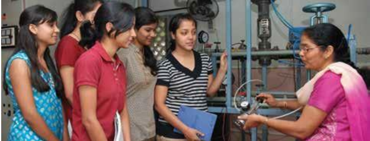
Cummins College of Engineering for Women in India ondersteunt een ondervertegenwoordigde demografische groep op het gebied van engineering

V Hoe kan ik deelnemen aan gemeenschapsactiviteiten bij Cummins?