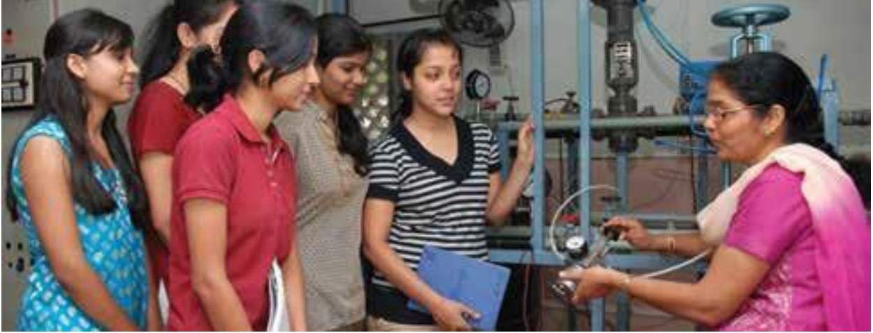
Hindistan'daki Kadınlar İçin Cummins Mühendislik Yüksekokulu, mühendislik alanında yetersiz temsil edilen bir demografik kesime hizmet eder.

S Cummins'in topluluk faaliyetlerine nasıl dahil olabilirim?